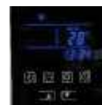
PANEL TACTIL DE ULTIMA GENERACION