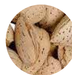
CÁSCARA DE ALMENDRA