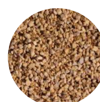
HUESOS DE OLIVA