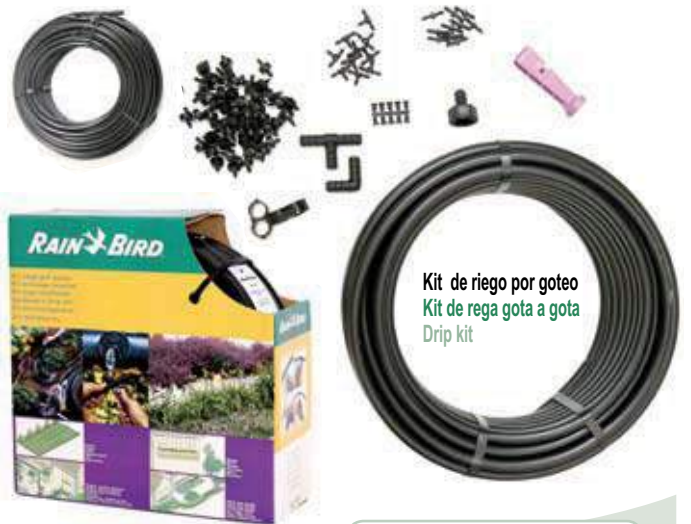
Kit de riego por goteo Kit de rega gota a gota Drip kit