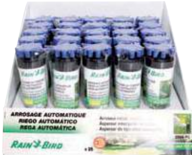
Aspersor de turbina emergente 3504 (de 3 a 10,7 mtr.) Aspersor de turbina emergente 3504 (de 3 a 10,7 mtr.) 3504 pop-up turbine sprinkler (from 3 to 10,7 mtr.)