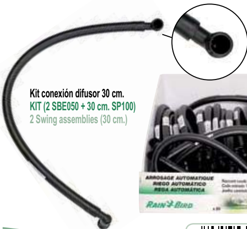
Kit conexión difusor 30 cm. KIT (2 SBE050 + 30 cm. SP100) 2 Swing assemblies (30 cm.)