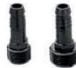
2 Racord recto extriado 1/2" SBA 050 2 Uniao canelado SBA 050 x 1/2" 2 Spiral barb adapter SBE 050 x 1/2"