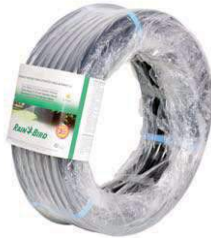
Tubo flexible 30m.: SP-100 (para aspersores y difusores) Tubo flexível 30 m.: SP-100 (para aspersores e difusores) SP 100 flexible tube (for sprinklers and diffusers)