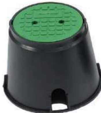
Arqueta circular para 2 válvulas Caixa para 2 válvulas redonda com mola na tampa Round 2 valves box with clip on cover