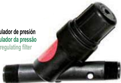
Filtro regulador de presión Filtro regulador da pressão Pressure regulating filter