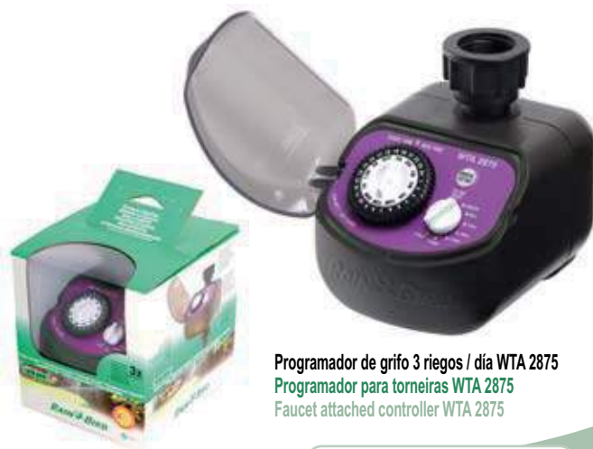
Programador de grifo 3 riegos / día WTA 2875 Programador para torneiras WTA 2875 Faucet attached controller WTA 2875

* VENTA MÍNIMA VENDA MÍNIMA MINIMUM SALE 6 Blisters