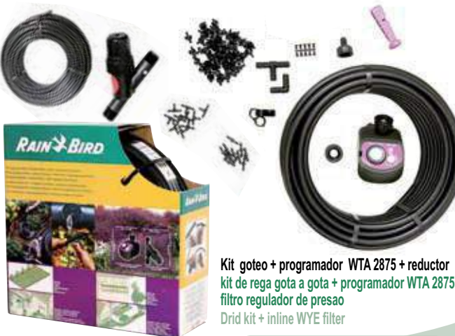
Kit goteo + programador WTA 2875 + reductor kit de rega gota a gota + programador WTA 2875 + filtro regulador de presao Drid kit + inline WYE filter