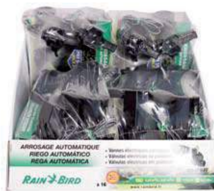
Pack 4 Electroválvulas H 1" JTV Pack de 4 valvulas electricas H 1" JTV Pack jar top valve H 1" JTV