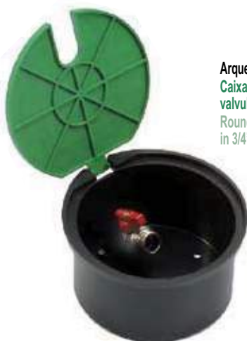
Arqueta circular con boca de riego Caixa para válvula com hidrante e válvula de 3/4" Round irrigation hydrant with built in 3/4"