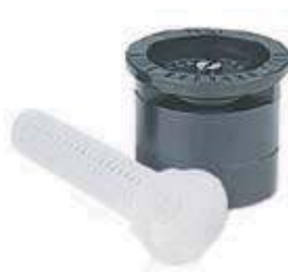
Tobera cuadrado 15 MPR Tubagem quadrada 15 MPR 15 MPR square nozzles