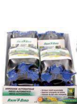
Pack 6 Aspersores 3504 (5 + 1) Pack 6 Aspersores 3504 (5 + 1) Pack 6 rotor pop-up 3504 (5+1)