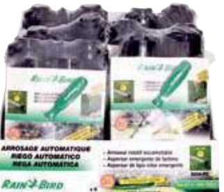
Pack 4 Aspersores 5004 Pack 4 aspersores 5004 Pack 4 rotor pop-up 5004