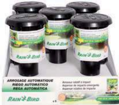
Aspersor emergente Maxi Paw Aspersor emergente de impacto Maxi Paw Impact rotor pop-up sprinklers Maxi Paw