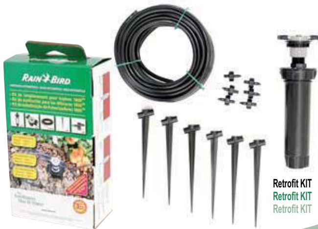
Retrofit KIT Retrofit KIT Retrofit KIT