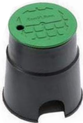
Arqueta circular para 1 válvula Caixa para 1 válvula redonda com tapa de acoplamiento Round 1 valve box with bayonet type cover