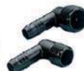
2 Racord codo extriado 2 coelho canelado 2 Spiral barb elbow