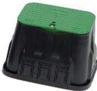
Arqueta rectangular 39 x 27 x 30,5 (3-4 válvulas) Caixa para (3-4 válvulas) valvulas rectangular com tapa Rectangular (3-4 valves) box with bolt lock cover