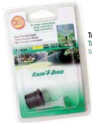
Tobera regulable VAN Tubagem regulável VAN VAN adjustable nozzles