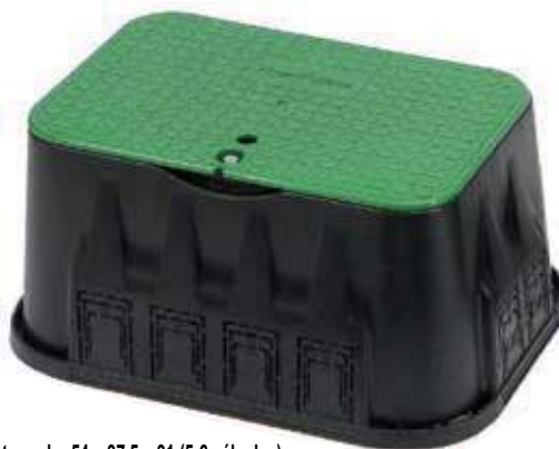
Arqueta rectangular 54 x 37,5 x 31 (5-6 válvulas) Caixa para (5-6) valvulas rectangular com tapa Rectangular (5-6 valves) box with bolt lock cover