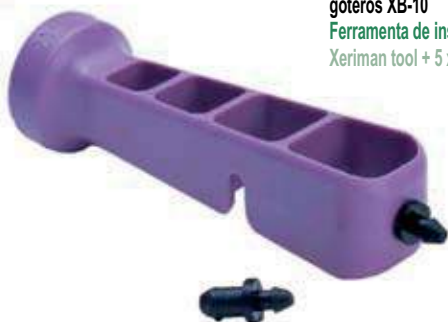
Herramienta para insertar goteros + 5 goteros XB-10 Ferramenta de instalacao + 5 gotejadores Xeriman tool + 5 xeri bug emitters