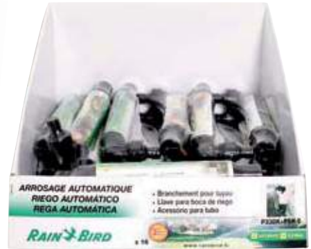
Llave para hidrante + codo Chave para aspersor + cotovelo Hydrant key + elbow