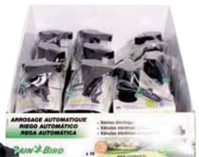
Electroválvula H 3/4" Low Flow (especial riego por goteo) Electro-válvula H 3/4" Low Flow (especial rega por gotejamento) H 3/4" low flow electro-valve (special for drip watering)