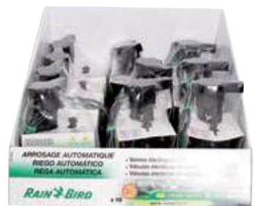
Electroválvula H 1" JTV Valvula electrica H 1" Jar top Valva H 1"