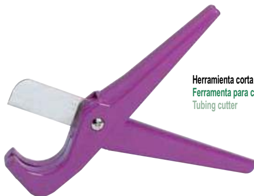
Herramienta corta tubos Ferramenta para corte de tubo Tubing cutter

* VENTA MÍNIMA VENDA MÍNIMA MINIMUM SALE 5 Blisters