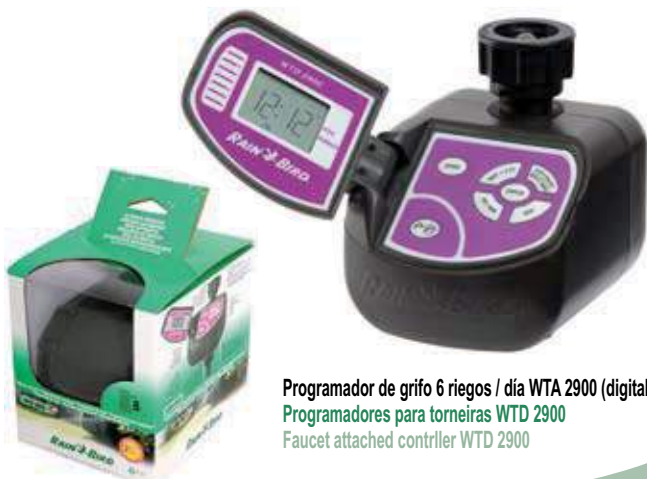
Programador de grifo 6 riegos / día WTA 2900 (digital) Programadores para torneiras WTD 2900 Faucet attached controller WTD 2900

* VENTA MÍNIMA VENDA MÍNIMA MINIMUM SALE 4 Blisters